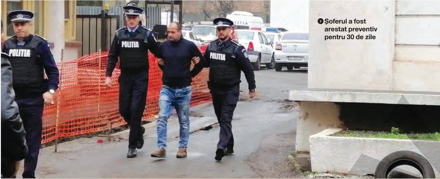
Soferul a fost arestat preventiv pentru 30 de zile

CERCETAT PENTRU CONDUCERE FĂRĂ PERMIS ● ACCIDENT