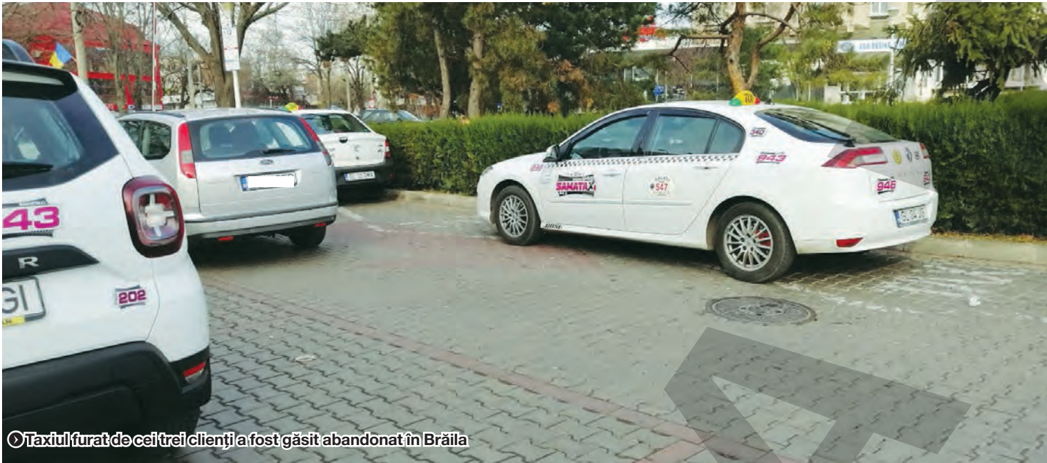
Taxiul furat de cei trei clienți a fost găsit abandonat în Brăila