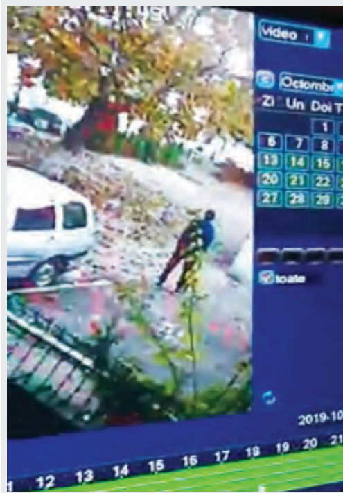
► Individul a fost filmat în timp ce fila locația (captură video)