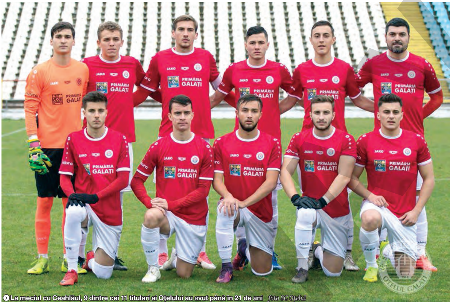
► La meciul cu Ceahlăul, 9 dintre cei 11 titulari ai Oțelului au avut până în 21 de ani