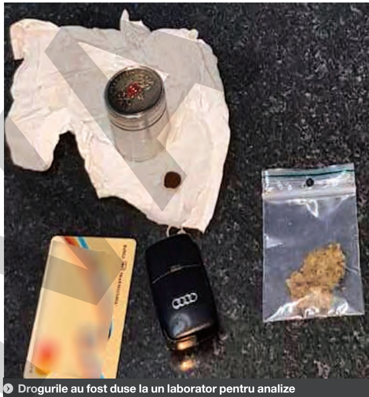
➤ Drogurile au fost duse la un laborator pentru analize

Descoperirea a fost făcută la sfârșitul săptămânii trecute, pe timpul desfășurării unei misiuni specifice de supraveghere și control în zona de competență a unui echipaj al Poliției de Frontieră din cadrul Sectorului Foltești. Polițiștii de frontieră au oprit pentru control, pe raza localității de frontieră Vlădești, un ansamblu de vehicule format dintr-un autoturism marca Audi A4, înmatriculat în Olanda, și o remorcă, înmatriculată în România. În urma verificărilor, oamenii legii au stabilit că la