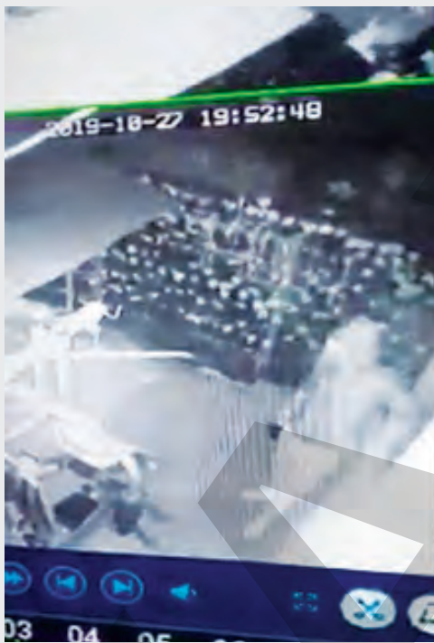
► Camerele de supraveghere au surprins și momentul în care hoțul forțează geamul (captură video)