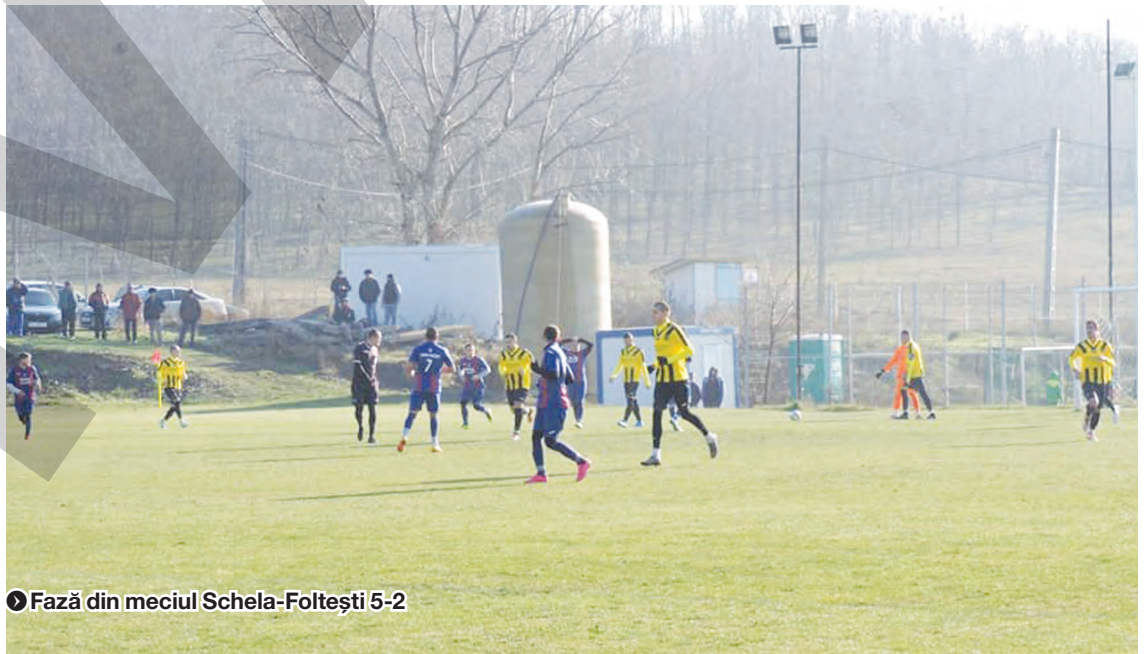
● Fază din meciul Schela-Foltești 5-2