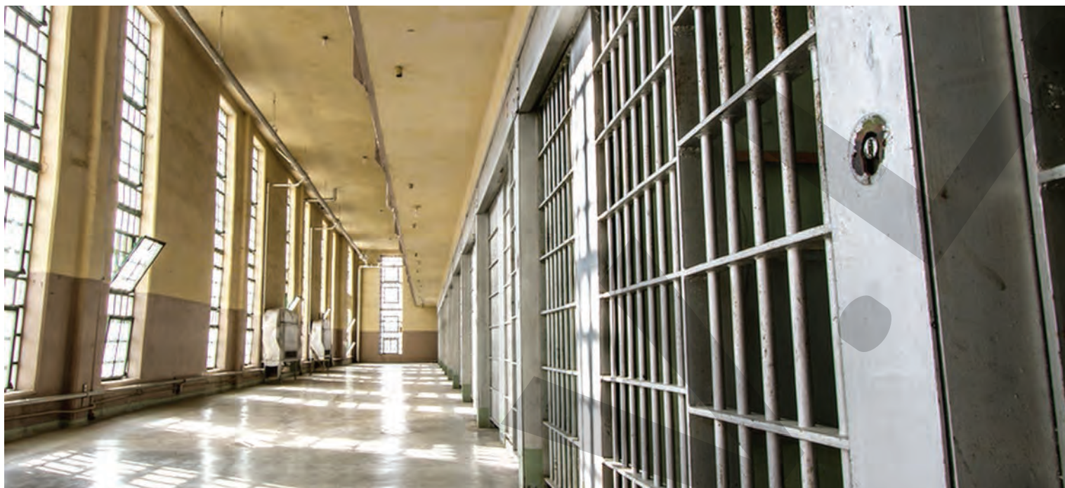
● Cele două penitenciare vor fi construite în Prahova și Buzău

scădea semnificativ, iar stratul de zăpadă nou depus va fi consistent. Totodată, în nordul Olteniei și al Munteniei temporar va ploua, iar în intervalul menționat se vor acumula cantități de apă de 20-25 l/mp și, izolat, 30 l/mp. ● T.M.