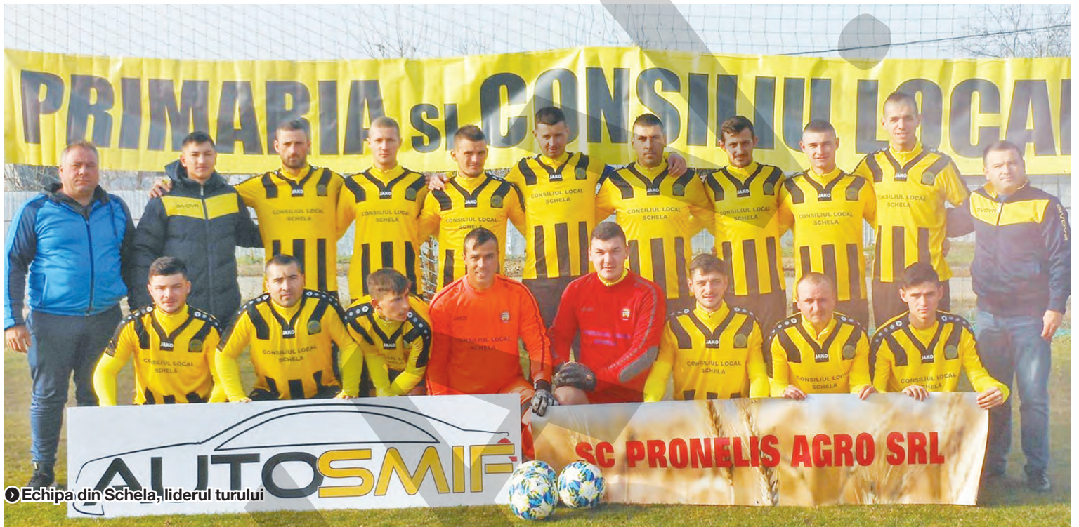
● Echipa din Schela, liderul turului

GHEORGHE ARSENIE gheorghe@viata-libera.ro