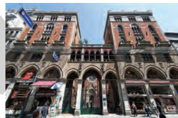
● Biserica Sfântul Anton de Padua - Istanbul

Hoțul nu știa că bijuterierul ascunsese între cărți rubinul cel fals. Bijuterierul lansase zvonul înlocuirii rubinelor. Se învățea pe lângă cel autentic, ascunzându-l câteva clipe privirilor de afară. De fapt, nici nu-l mișca din loc pe cel autentic.