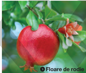
Floare de rodie

care includea miez și semințe, a fost dat celor 60 de voluntari