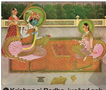
Krishna și Radha, jucând șah

ORIGINI. Există mai multe versiuni despre originea șahului, cele mai răspândite dintre ele consideră ca țară de origine India, Persia și China. Perioada în care a apărut jocul de șah se apreciază că a fost între secolul al III-lea și secolul al VI-lea. În general, se consideră că șahul provine din jocul indian Chaturanga, de acum aproximativ 1.400 de ani. Despre descoperirea jocului sunt nenumărate legende, printre care una dintre cele mai renumite este legenda cu boabele de grâu. Izvoarele istorice atestă faptul că se juca șah prin secolul al VI-lea în Persia. Jocul s-a răspândit prin secolul al VII-lea, odată cu extin-