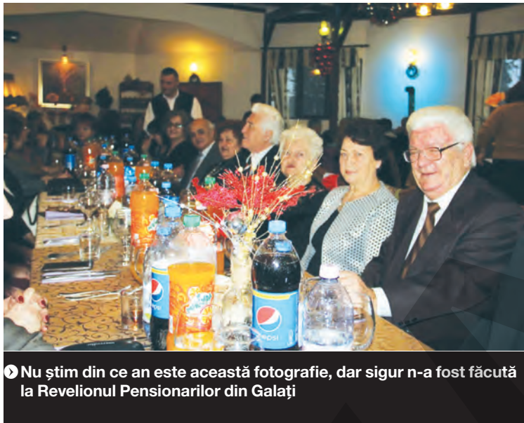
» Nu știm din ce an este această fotografie, dar sigur n-a fost făcută la Revelionul Pensionarilor din Galați

Ne-am făcut griji, dar numai preț de câteva ore, că alte cutume ale orașului de la Dunăre vor