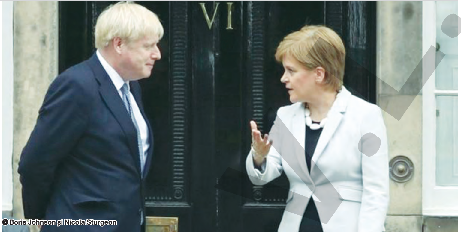
● Boris Johnson și Nicola Sturgeon