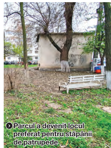
● Parcul a devenit locul preferat pentru stăpânii de patrupeze

pe aici, mai ales că avem și stâlpi care nu mai au becuri, iar noaptea este întuneric beznă. Am tot