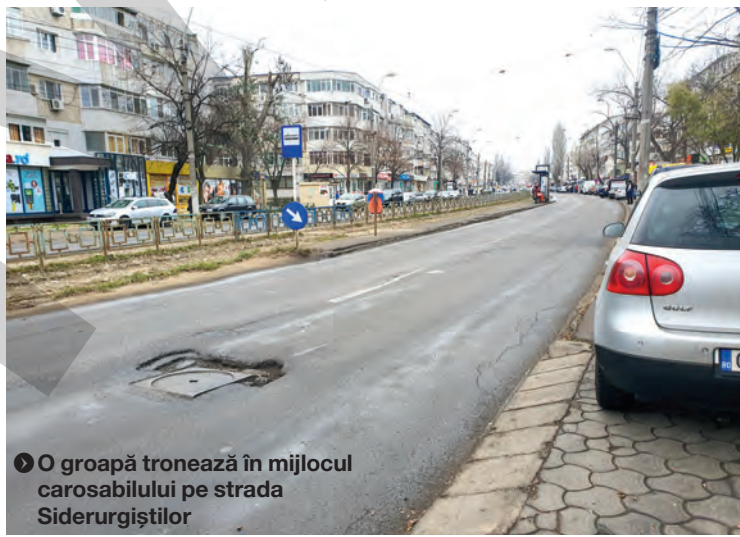
● O groapă tronează în mijlocul carosabilului pe strada Siderurgiștilor

Unul dintre cititorii veniți la întâlnirea de joi, de la chioșcul de ziare din Doja, a ținut să menționeze câteva dintre problemele majore ale zonei. „Trotuarele nu au mai fost asfaltate de zeci de ani. Ne rupem picioarele