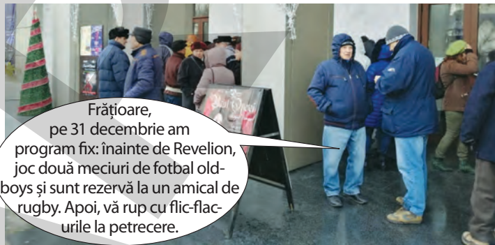
Frăția, pe 31 decembrie am program fix: înainte de Revelion, joc două meciuri de fotbal old-boys și sunt rezervă la un amical de rugby. Apoi, vă rup cu flic-flacurile la petrecere.

» Coadă de la biletele pentru petrecerea din noaptea de Anul Nou a pensionarilor gălățeni a făcut înconjurul României. Al Jazzera, ai ratat-o pe asta!