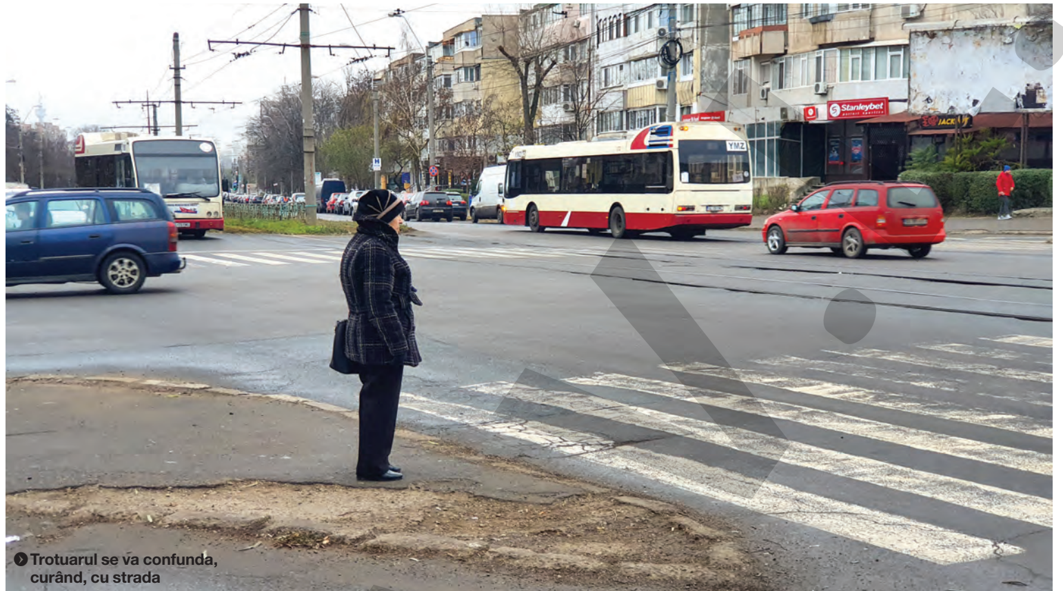
● Trotuarul se va confunda, curând, cu strada

CARTIERUL DOJA A FOST UITAT DE AUTORITĂȚI ● REPORTAJ