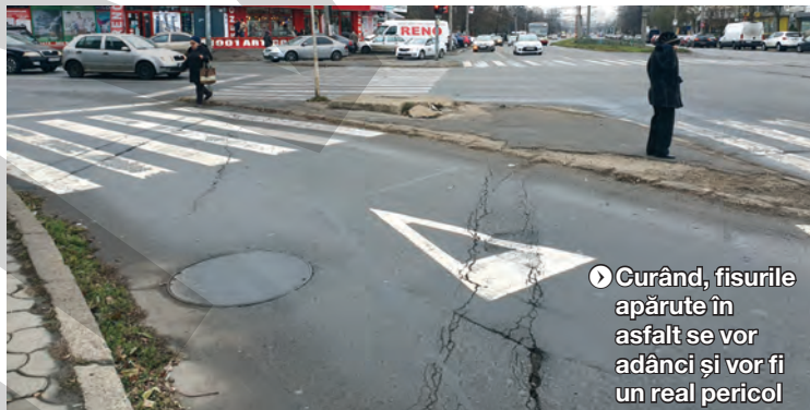
Curând, fisurile apărute în asfalt se vor adânci și vor fi un real pericol

Oamenii au acum parte de un pic de liniște. Și asta pentru că circulația pe strada Frunzei este închisă, iar tramvaiile nu mai pot circula. Situația va reveni însă la „normal” după ce va fi reparată strada afectată de explozia de la fosta stație Peco. „Nu a anunțat nimeni cum și cu ce se circulă pe traseul 39. Oamenii sunt debusolați pentru că nu