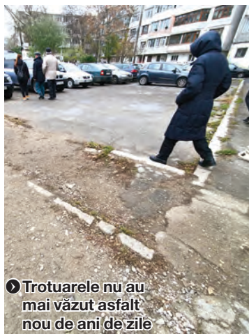
● Trotuarele nu au mai văzut asfalt nou de ani de zile

pe aici, mai ales că avem și stâlpi care nu mai au becuri, iar noaptea este întuneric beznă. Am tot