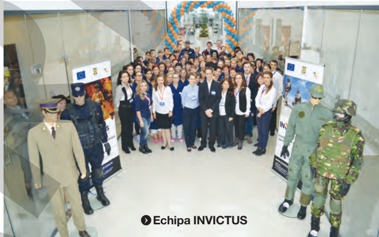
● Echipa INVICTUS

Prin intermediul „Vieții libere”, în prag de sărbători, INVICTUS® dorește să le mulțumească tuturor clienților, furnizorilor, partenerilor și colegilor de breaslă pentru colaborarea din ultimul an, urându-le succes și satisfacții personale și profesionale! ●