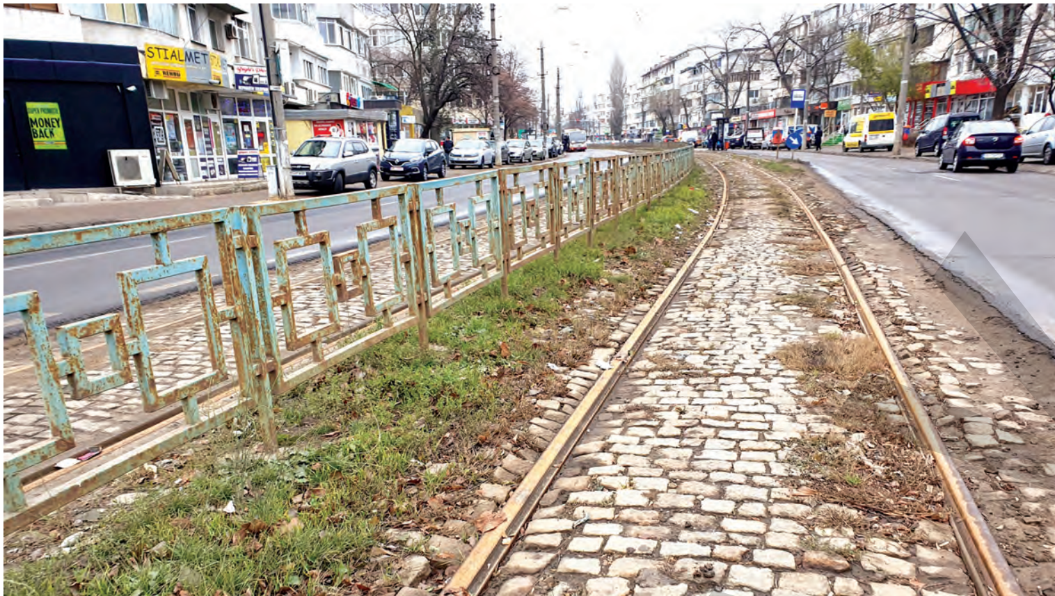
Linia de tramvai are o vechime mult prea mare

LOCATARII CER AUTOBUZE ÎN LOC DE TRAMVAIE ● SOLUȚII