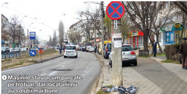
Mașinile stau acum parcate pe trotuar, dar locatarii nu au soluții mai bune