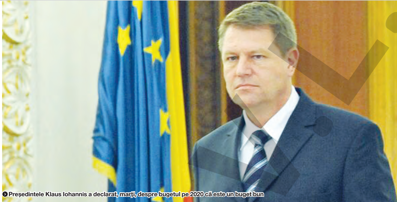
● Președintele Klaus Iohannis a declarat, marți, despre bugetul pe 2020 că este un buget bun