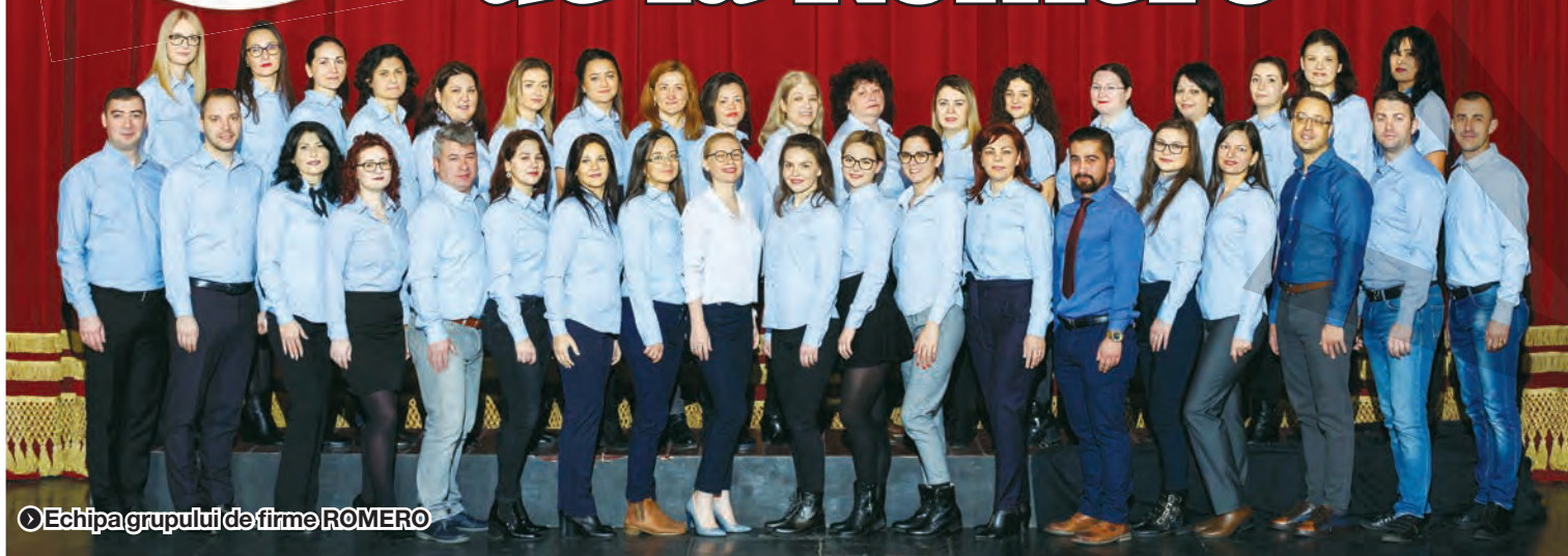
● Echipa grupului de firme ROMERO