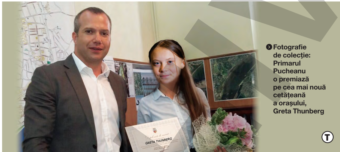
● Fotografie de colecție: Primarul Pucleanu o premiază pe cea mai nouă cetățeană a orașului, Greta Thunberg

„Abia după ce am fost desemnată personalitatea anului 2019, mi-am pus cu adevărat problema relocării și aș vrea să mă mut în orașul dumneavoastră”, i-a spus Greta, într-o limbă română aproximativă, primarului. „Nu este o glumă, am citit că bugetul județului va fi cu circa 25 de milioane de euro mai mic în 2020, deci nu se va mai investi în nimic, va rămâne natura neatinsă, în oraș nu s-a mai construit mai nimic, industria este la pământ, deci nu mai e poluarea de altă dată, și sunt semne încurajatoare că va dispărea și Combinatul Siderurgic. Galațiul va deveni un rai, păsările planetei aici vor migra, sunt foarte emoționată că ați reușit acest lucru”, a continuat suedeza, într-o atmosferă emoționantă. Bine ai venit la noi, Greta, și la mulți ani! ● Asta la activista, baby