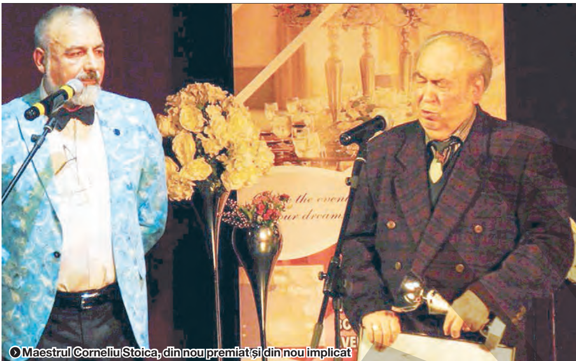
Maestrul Corneliu Stoica, din nou premiat și din nou implicat