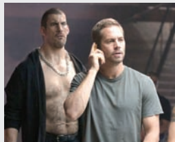
Franta, Canada, Acțiune, Crimă, Dramă