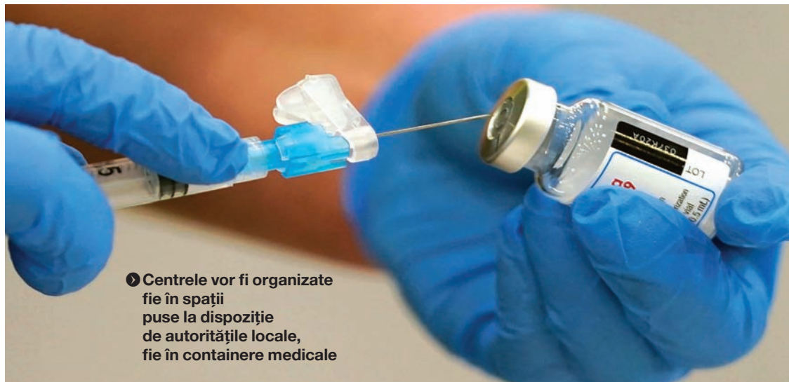
► Centrele vor fi organizate fie în spații puse la dispoziție de autoritățile locale, fie în containere medicale

Aceste centre mobile vor fi coordonate de Direcția medicală a MAPN și "vor acționa, începând de săptămâna viitoare, în sprijinul autorităților locale, în localități izolate sau greu accesibile, care urmează a fi stabilite de Centrul Național de Conducere și Coordonare a Intervenției și Comitetul Național de Coordonare a Activităților privind Vaccinarea. Personalul care va fi încadrat în aceste centre mobile (medici, asistenți medicali, registratori medicali) face parte din unități militare și instituții medicale ale MAPN din București, Craiova, Brașov, Cluj-Napoca, Pitești, Focșani, Timișoara, Constanța, Galați, Iași și Sibiu", se arată în comunicatul de presă al MAPN.