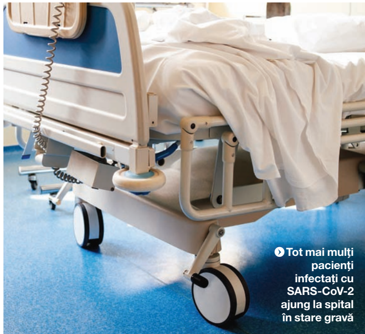
● Tot mai mulți pacienți infectați cu SARS-CoV-2 ajung la spital în stare gravă