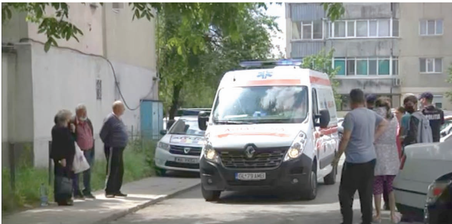
● O ambulanță a transportat-o pe fată la spital

INCIDENT CU POTENȚIALE URMĂRI GRAVE ÎN IC FRIMU ● URGENTĂ