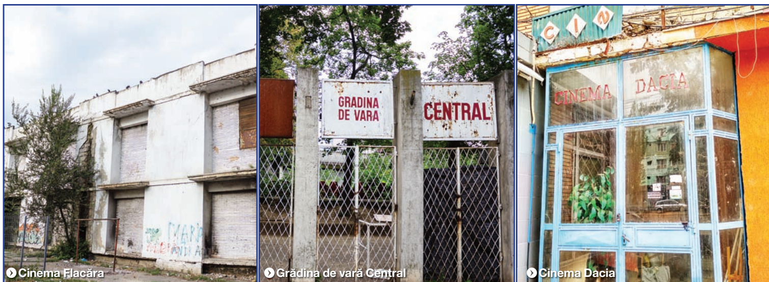
▶ Cinema Flacăra