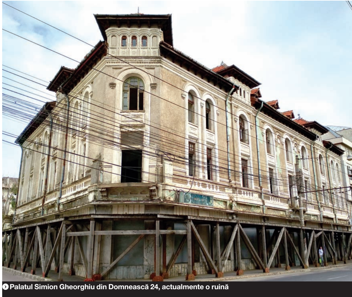
Palatul Simion Gheorghiu din Domnească 24, actualmente o ruină

Din discuțiile purtate în CL, premergătoare votului, a reieșit că municipalitatea caută în continuare soluții pentru ca Parcul de Soft să nu dispară complet. „Societatea are de recuperat niște