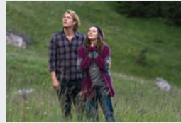
Germania, China, SUA, Acțiune, Crimă, Sport, Thriller