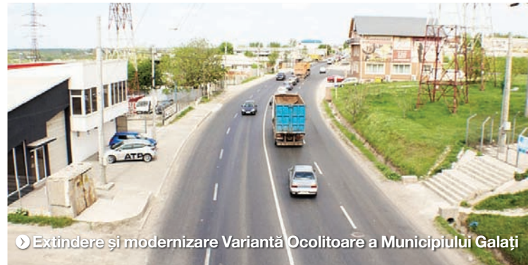
Extindere și modernizare Variantă Ocolitoare a Municipiului Galați