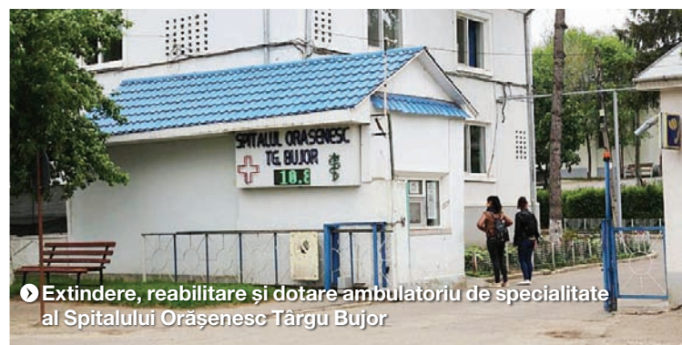
Extindere, reabilitare și dotare ambulatoriu de specialitate al Spitalului Orășenesc Târgu Bujor