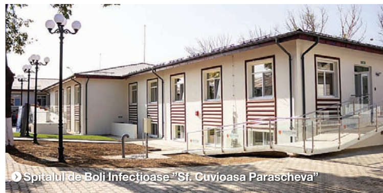
Spitalul de Boli Infecțioase "Sf. Cuvioasa Parascheva"