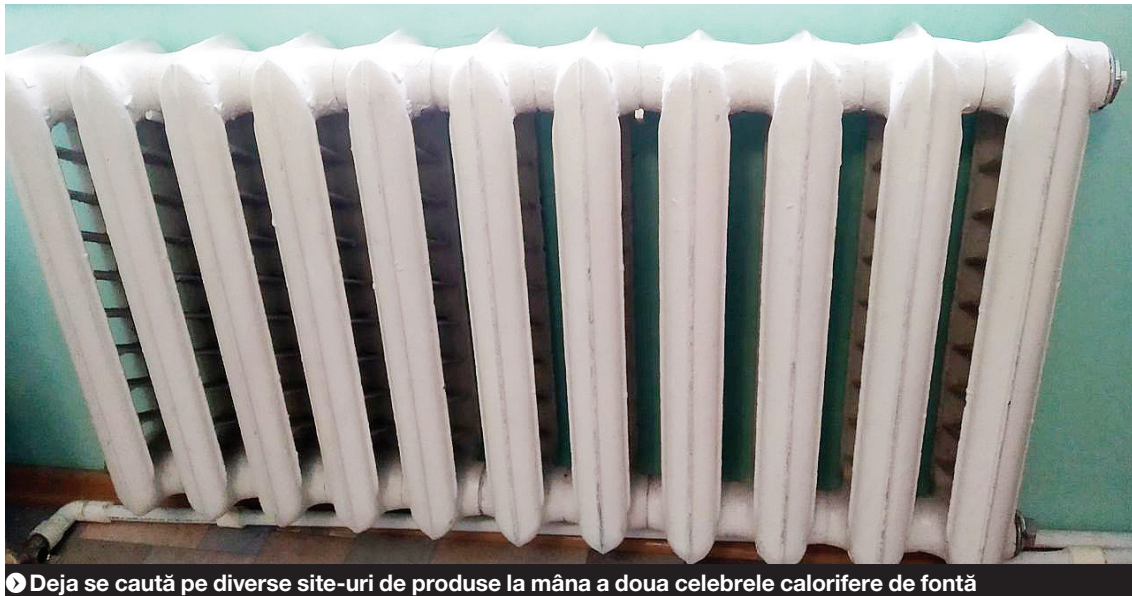
Deja se caută pe diverse site-uri de produse la mâna a doua celebrele calorifere de fontă

L-am întrebat de unde această idee năstrușnică, iar domnia sa ne-a înșirat argumente ca la Dunărea de Jos, poate imposibil de înțeles în altă regiune a țării. „Doar trăiți și dumneavoastră aici, ce naiba! De câte ori n-ați avut datorii la întreținere, de-alea istorice, și ați avut în continuare căldură și apă caldă?! Când era și apa aia, sâmbăta, ca să faci o baie, dar era în condițiile în care zerourile din datoria la întreținere nu se mai terminau. Asta e cea mai bună formă de orânduire, ba chiar la paușal, cum spuneam, adică, fără contor. Să consumi cât poți și să plătești când îți aduci aminte. Jos capitalismul!”, s-a enervat pe final numitul Calorifescu de la Asociația Paușalul Universal. ● CaloRio de Janeiro