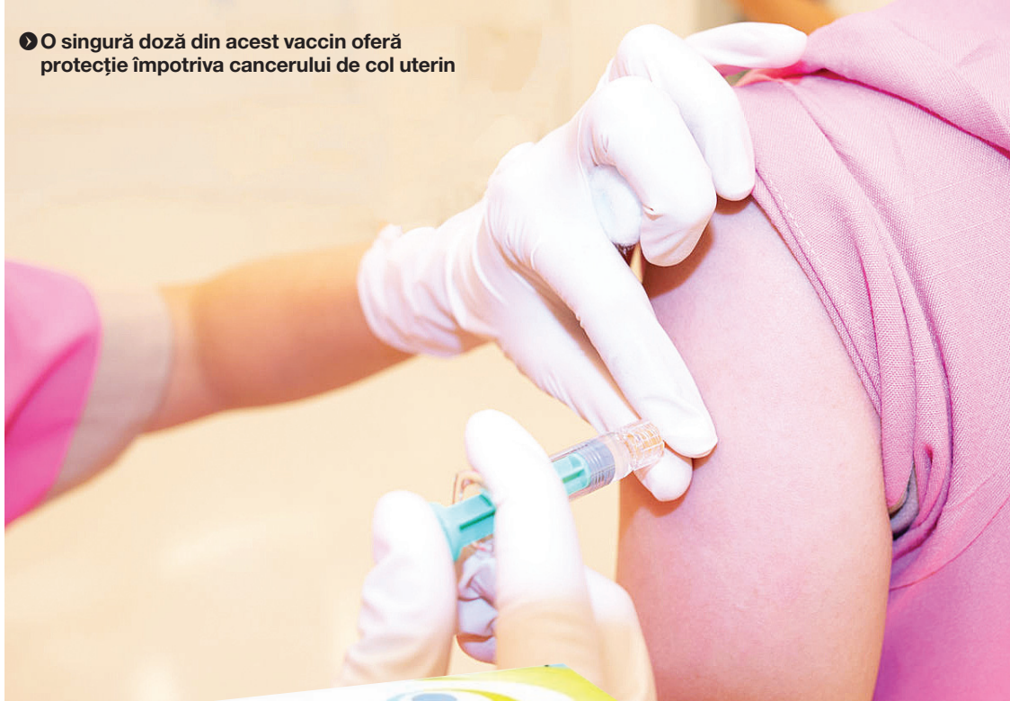
● O singură doză din acest vaccin oferă protecție împotriva cancerului de col uterin

Vaccinarea anti-HPV se realizează la persoanele eligibile pe baza solicitărilor părinților/reprezentanților legali, care transmit cererile către medicii de familie. Cererile sunt centralizate în ordinea cronologică a datei de înregistrare, iar trimestrial se