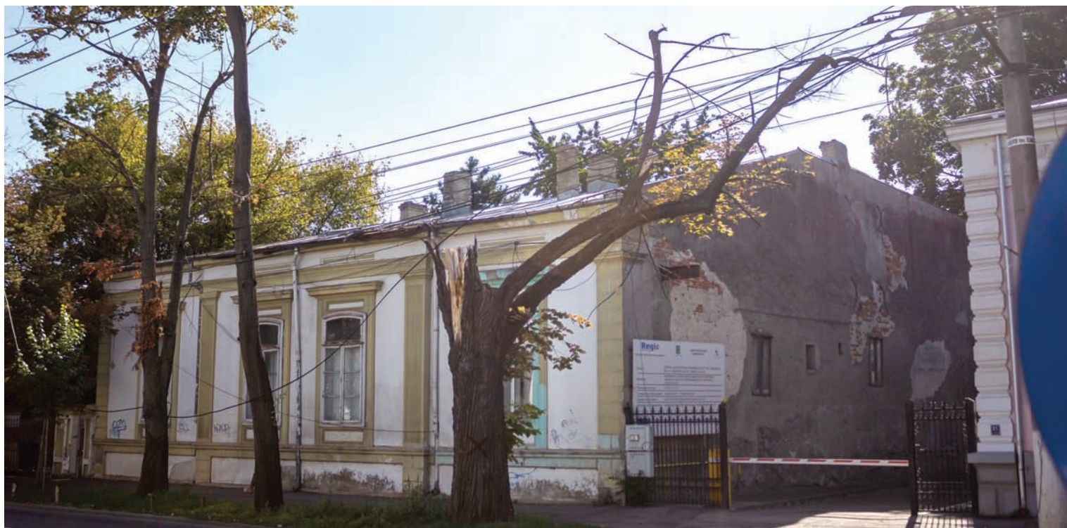
GALAȚIUL, ORAȘUL PERICOLELOR PUBLICE LA TOT PASUL ● SESIZĂRI

TRAGEDIE. Un accident feroviar, soldat cu moartea unui băiat în vârstă de 17 ani din Piscu, a avut loc în cursul nopții de marți spre miercuri. În împrejurări care urmează să fie elucidate de ancheta poliției, tânărul a fost surprins pe calea ferată, în apropierea haltei Bucești, în comuna Ivești, imediat după ce trenul Regio 7575, care venea de la Mărășești spre Galați, a plecat din stație. Mecanicul locomotivei ar fi încercat să frâneze pentru a-l evita pe tânărul apărut pe șine, dar nu a putut opri garnitura la timp. Impactul i-a fost fatal tânărului, la sosirea echipajelor de salvare acesta fiind găsit decedat. Polițiștii de la Transporturi au deschis un dosar penal pentru ucidere din culpă, urmând a stabili circumstanțele exacte care au dus la producerea tragediei. Una dintre variantele posibile luate în calcul este sinuciderea. ● Mariana Constandache