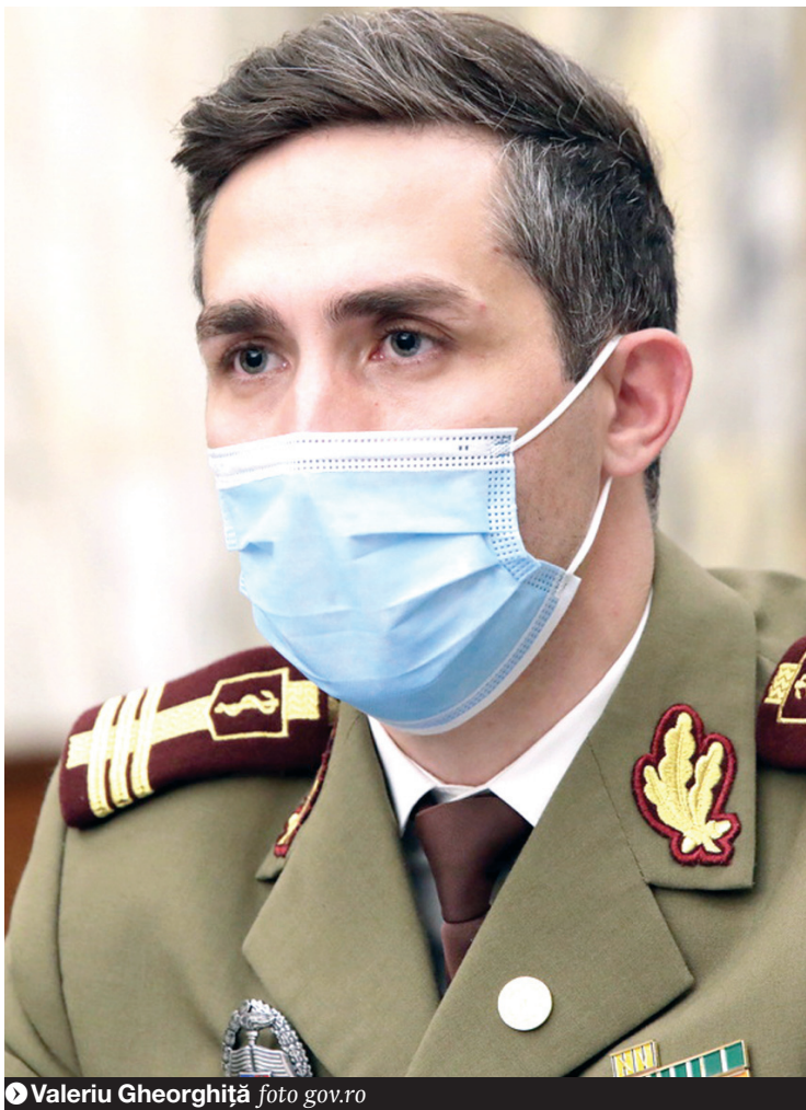
Valeriu Gheorghiu

nală de vaccin împotriva COVID-19. Pe de o parte, vorbim de o doză suplimentară de vaccin la anumite categorii de persoane imunodeprimite, cum sunt persoanele post-transplant sau persoanele care sunt în evidență cu afecțiuni oncologice în tratament activ, persoanele cu alte condiții de imunodepresie, fie primară, fie dobândită, cum este infecția HIV netratată sau în stadii avansate. De asemenea, persoanele care fac terapii imunosupresoare, fie corticoterapie, fie terapie biologică, vor avea indicație de a efectua trei doze de vaccin în cadrul primei scheme de vaccinare, în loc de două doze, câte sunt recomandate în acest moment. Această autorizație a fost deja acordată de Agenția Americană pentru Medicamente și Alimente. Agenția Europeană a Medicamentului evaluează această indicație, atât pentru vaccinul BioNTech/Pfizer, cât și pentru Moderna", a afirmat Valeriu Gheorghiu.