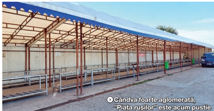
● Cândva foarte aglomerată, „Piața rușilor” este acum pustie

www.viata-libera.ro Viata așa cum e SPECIAL