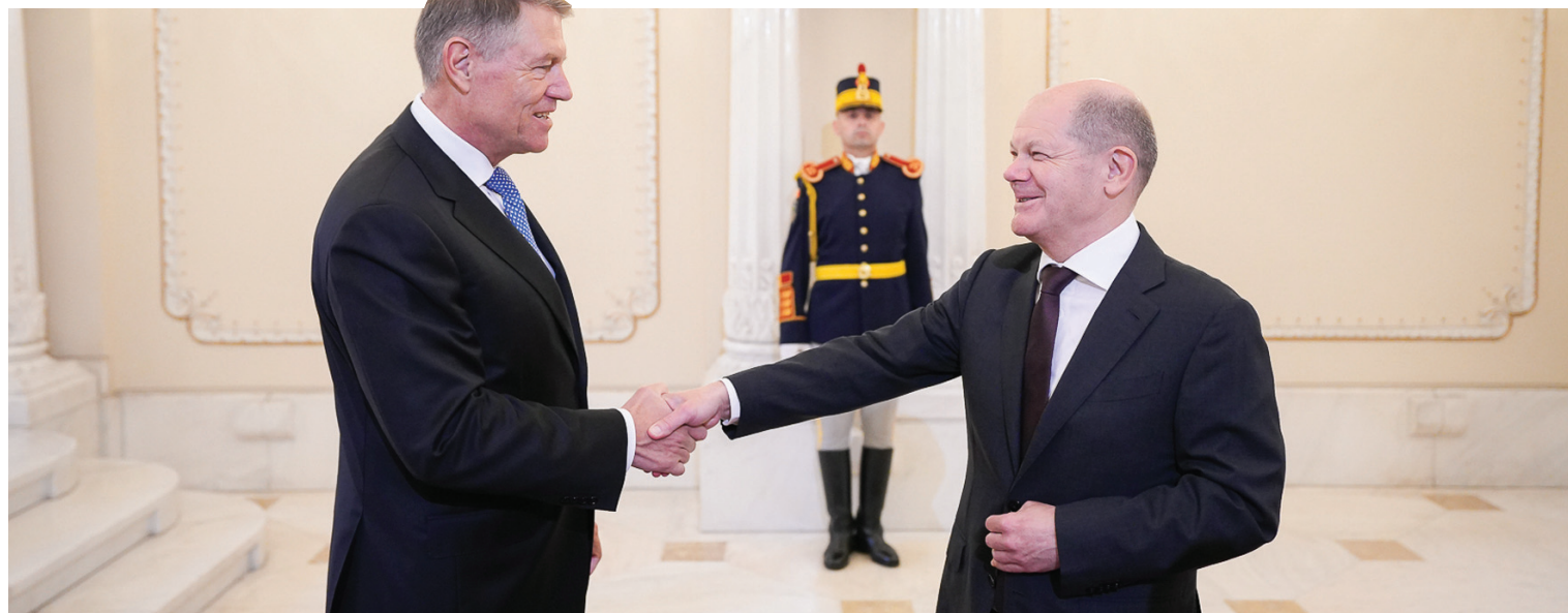
CONFERINȚĂ DE PRESĂ COMUNĂ CU CANCELARUL OLAF SCHOLZ ● APRECIERE

Procurorii nu vor prag pentru abuzul în serviciu