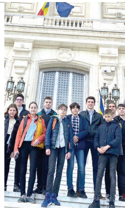
● Lotul care a reprezentat Galațiul la Naționala de Lingvistică