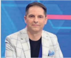
cu Dan Negru