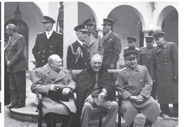
● De la stânga la dreapta, Churchill, Roosevelt și Stalin. La brâu ofițerului cu fireturi din spatele lor, sabia cu care s-a tăiat Europa în două

ia act că rebelul între România și Turcia, că ruperea legăturilor noastre cu Pôrta și independența absolută a României au primit consacarea lor oficială”.