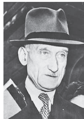
● Jean-Baptiste Nicolas Robert Schuman, unul dintre părinții fondatori ai Uniunii Europene