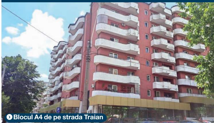
▶ Blocul A4 de pe strada Traian