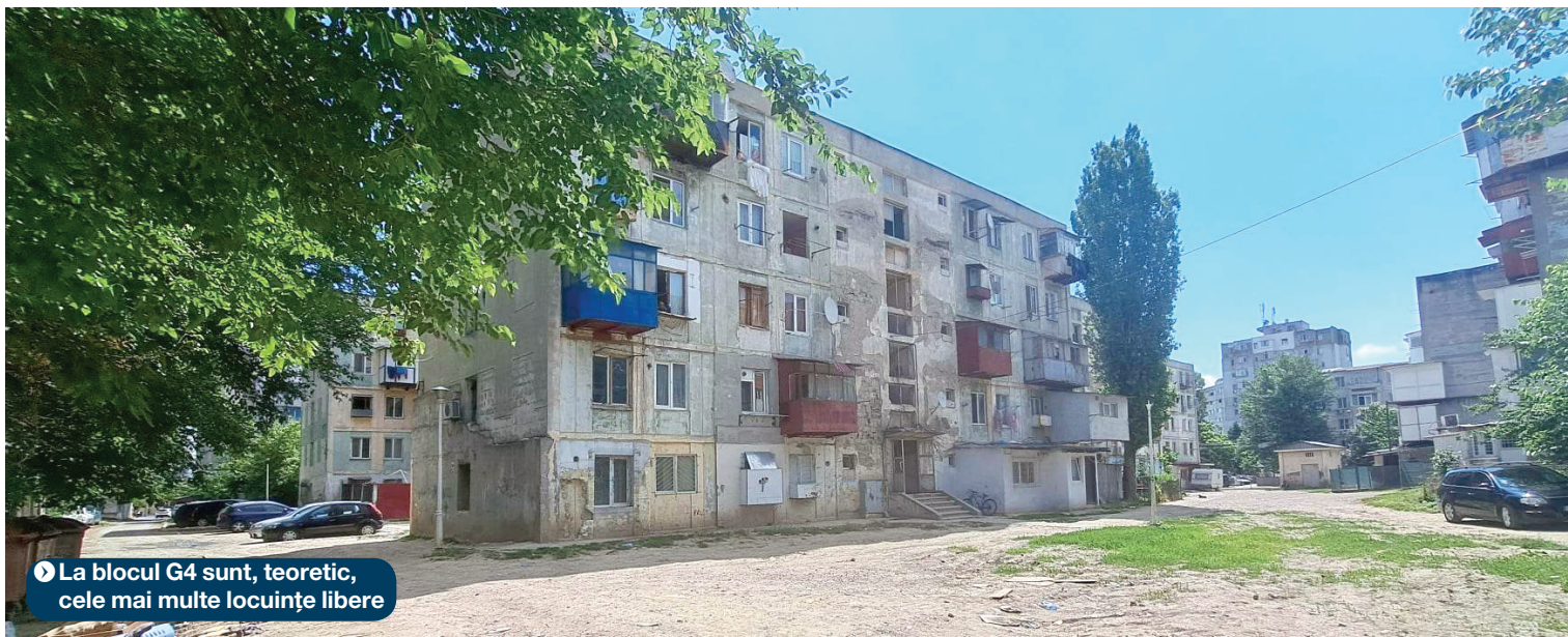
▶ La blocul G4 sunt, teoretic, cele mai multe locuințe libere