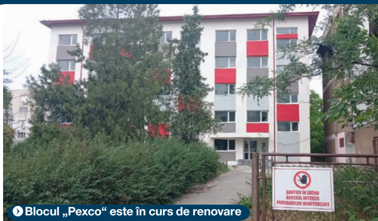
▶ Blocul „Pexco” este în curs de renovare