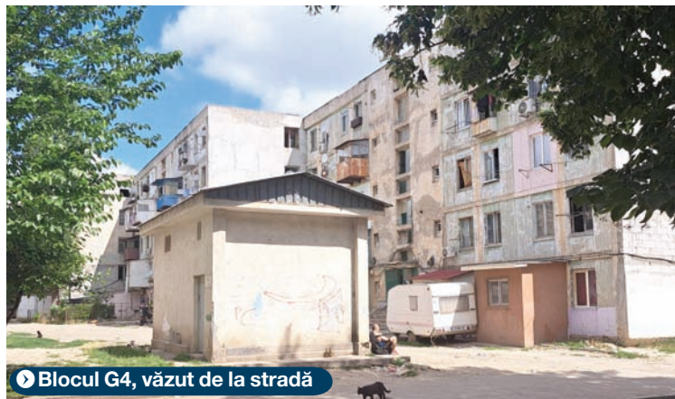
▶ Blocul G4, văzut de la stradă

ilor de reabilitare, dar și al comportamentului oamenilor care îl locuiesc, care nu doar că nu au făcut nici cel mai mic efort să îl îngrijească, dar l-au distrus sistematic, prin acțiuni la limita penalului.