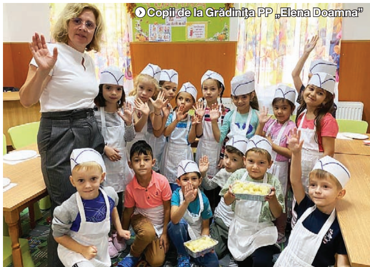
Copii de la Grădinița PP „Elena Doamna”