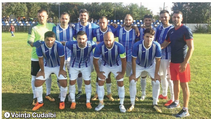
► Voința Cudalbi