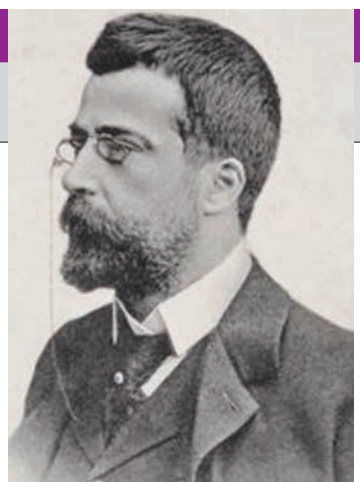
A încetat din viață pe 6 noiembrie 1929, la Lisabona. ● R.C. (diferite surse)

formând generații de pictori moderni. Este considerat unul dintre cei mai importanți pictori portughezi ai secolului al XIX-lea, un maestru al portretului psihologic, realizat într-o paletă sobră, dar profund expresivă, și un reprezentant de frunte al naturalismului iberic. Cele mai bune colecții ale picturilor sale se află în Muzeul Chiado din Lisabona și Muzeul Național Soares dos Reis din Porto.