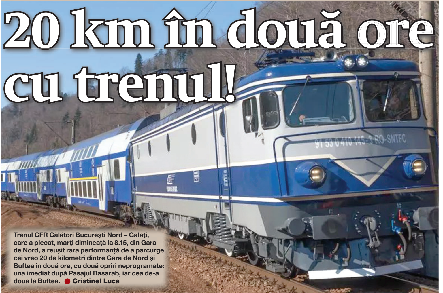
Trenul CFR Călători București Nord – Galați, care a plecat, marți dimineață la 8.15, din Gara de Nord, a reușit rara performanță de a parcurge cei vreo 20 de kilometri dintre Gara de Nord și Buftea în două ore, cu două opriri neprogramate: una imediat după Pasajul Basarab, iar cea de-a doua la Buftea. ● Cristinel Luca