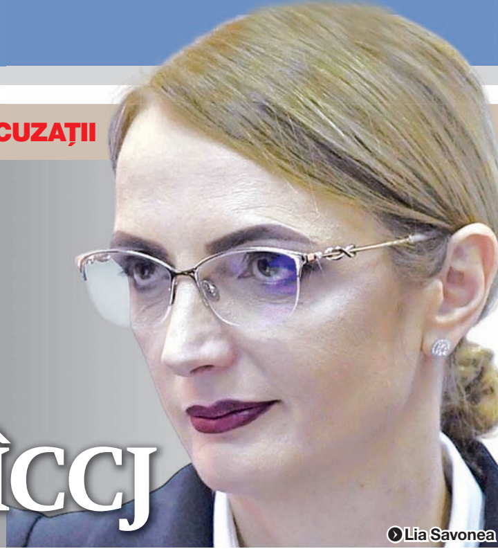
● Lia Savonea