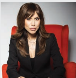
cu Denise Rifai (R)

KANAL D 07:00 Știrile Kanal D (R) 07:15 40 de întrebări 09:45 Sport, dietă și o vedetă 10:15 Asta-i România! (R) 12:00 Știrile Kanal D 13:00 În căutarea adevărului 14:45 ROventura 16:00 Casa iubirii 18:00 Știrile Kanal D 19:00 Casa iubirii 21:00 The floor 23:00 40 de întrebări cu Denise Rifai 01:30 Brahms: Băiatul II (R) SUA, Horror, Mister, Thriller