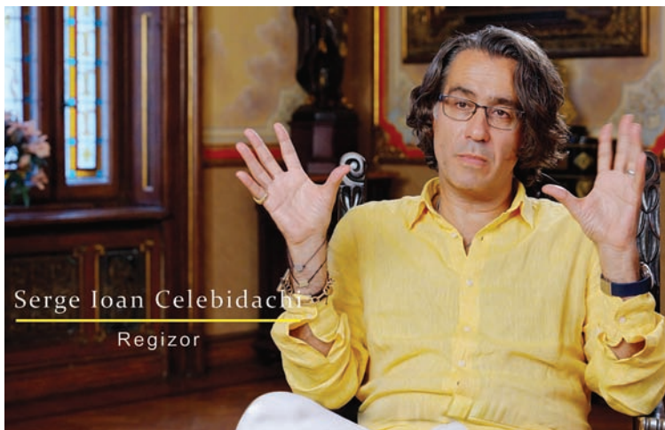
Serge Ioan Celibidachi Regizor