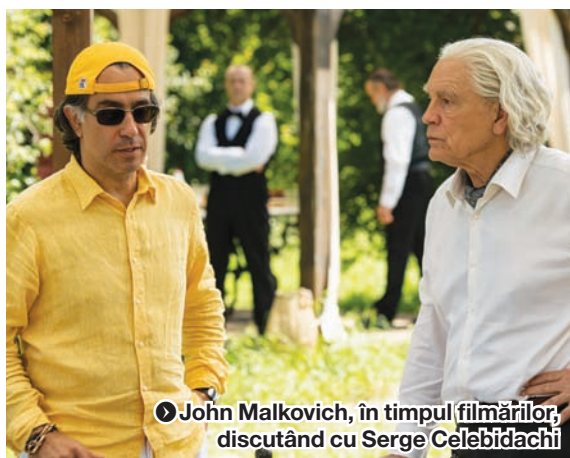
John Malkovich, în timpul filmărilor, discutând cu Serge Celibidache