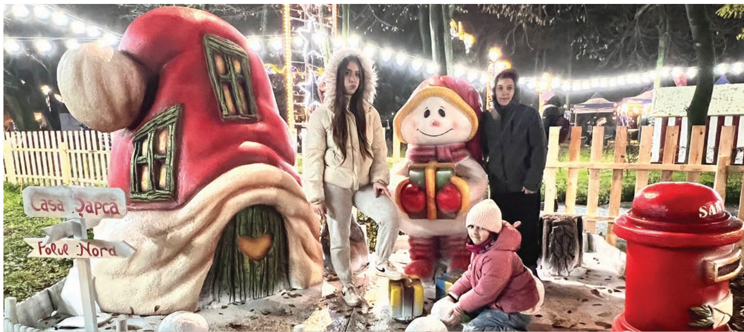
ATRAȚII PENTRU TOATE VÂRSTELE ÎN GRĂDINA PUBLICĂ ● FESTIVAL