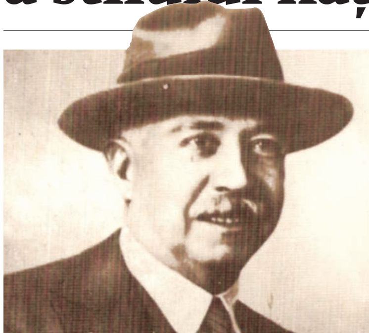
Pictorul și academicianul Gheorghe Petrașcu s-a născut pe 1 decembrie 1872, la Tecuci.

Aurmat studii la Universitatea Națională de Arte din București. La recomandarea lui Nicolae Grigorescu, a primit o bursă în străinătate, mai întâi la München, apoi la Paris, studiind la Academia Julian și lucrând în atelierul lui Bouguereau (1899-1902).