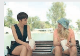
Ești mai deștept decât un copil de clasa a V-a?