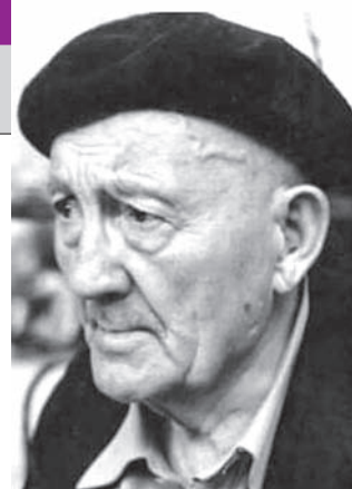
Portrete, Corespondență“ etc.

Dintre lucrările sale, amintim: „Omul – Tratat de antropologie creștină“, „Între Dumnezeu și neamul meu“, „322 de vorbe memorabile“, „Filozofia nuanțelor: Eseuri,