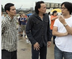
SUA, Acțiune, Dramă, Thriller

07:00 Știrile Pro Tv 10:30 Vorbește lumea 13:00 Știrile Pro Tv 14:00 Lecții de viață 15:00 La Maruță 17:00 Știrile Pro Tv 18:00 Batem palma? 19:00 Știrile Pro Tv 20:30 Las Fierbinți Romania, Comedie 21:30 Trădătorii 23:30 Știrile Pro Tv 00:00 Asasinul din Bangkok