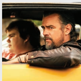
SUA, Africa de Sud, Acțiune, Comedie